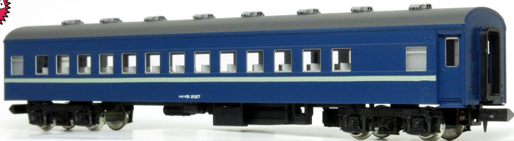
スロフ51として組んだ完成例