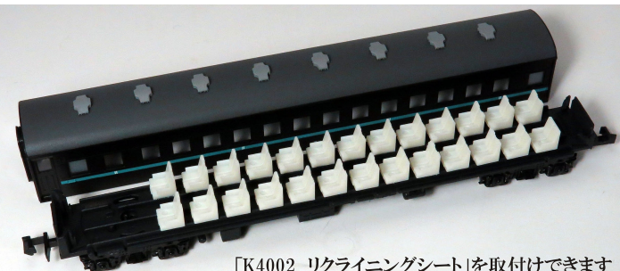
「K4002 リクライニングシート」を取付けてできます (一つずつ切り離して配置)